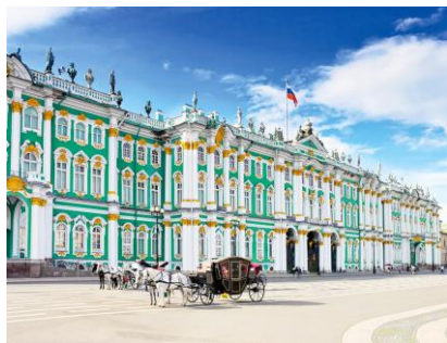
Museo Hermitage -S.Pietroburgo

12-19 AGOSTO 2017 Voli di linea LUFTHANSA da Bari Pensione completa – 11 visite turistiche – cena con musica Folk